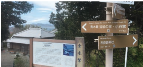
青木繁「海の幸」記念館・小谷家住宅 〒294-0234 千葉県館山市布良 1256 毎週土・日曜（お盆時期・年末年始を除く） 4～9月 10:00～16:00 10～3月 10:00～15:00 入館料（維持協力金） 一般 200円

私が小学生の頃、学校に「海の幸」の写真が飾られていたのですが、あんな下品な絵は大嫌いと感じていました。日本で最初の洋画の重要文化財「海の幸」が描かれた布良は、美術界の聖地と呼ばれているそうです。2008年には、布良の活性化を目ざして「青木繁《海の幸》誕生の家と記念碑を保存する会」ができました。青木繁が過ごした小谷家住宅を保存するために、全国の画家の皆さんと一