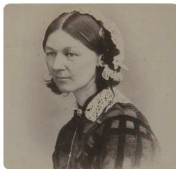
看護に目覚めてヨーロッパ中の病院・施設を精力的に回った若き日々

フローレンス・ナイチンゲール (1820-1910) Florence Nightingale