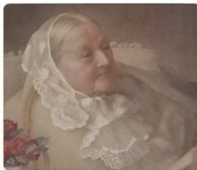
約150点もの膨大な著作を残して90年の生涯を閉じた