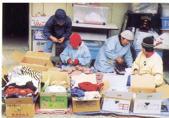
かにた村の作業風景